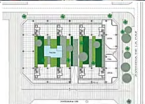
PLANTA SUR NO 100

Este fascinante proyecto es un conjunto residencial que se presenta con una fachada alineada en sus lados rectos y en curvas y un chaflán en las esquinas. También cuenta con una rotura en forma de V que se aprecia a la vuelta redonda. Sus líneas rectas producen un alto impacto visual que refuerzan la configuración dinámica y escalonada de sus terrazas. Son estas partes las que presentan una mayor coherencia formal, ya que las curvas de las esquinas se conectan con las terrazas y se configuran con una sutil inclinación. Desde la jardinería, o el diseño de los soportales, pasando por las terrazas, miradores, locales comerciales, pérgolas en cubierta, e incluso el vallado en el primer nivel, forman parte de una fachada que juega con las curvas y las separaciones.