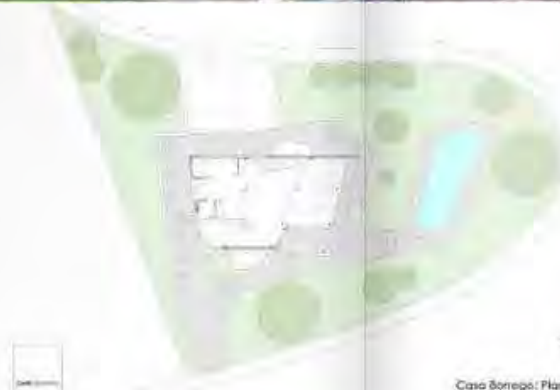
Casa Borrego: Planta baja